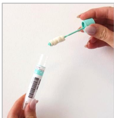
Figura 1: provetta con etichetta.

Aprire la provetta "LolliSponge" per la raccolta della saliva con applicata l'etichetta identificativa dell'utente applicata ( figura 1 ) e procedere all'esecuzione del prelievo salivare ( figura 2 ):