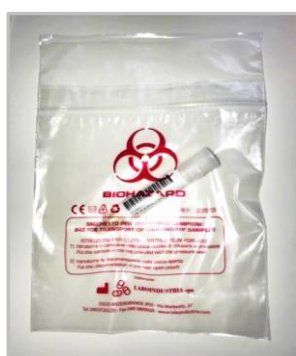
Figura 3: tampone all'interno della busta per il trasporto

Una volta eseguito il prelievo salivare introdurre la provetta con il tampone all'interno della busta per il trasporto dei campioni biologici ( Figura 3 ) e consegnarlo al personale scolastico di riferimento non appena giunti a scuola.